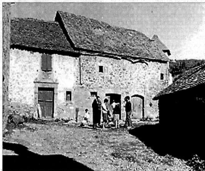
►► Antigua imagen de Casa Bonanzas.

Para que la reversión se haga efectiva, los antiguos propietarios de las dos casas tienen 15 días para aceptar el precio fijado por la CHE. ≡